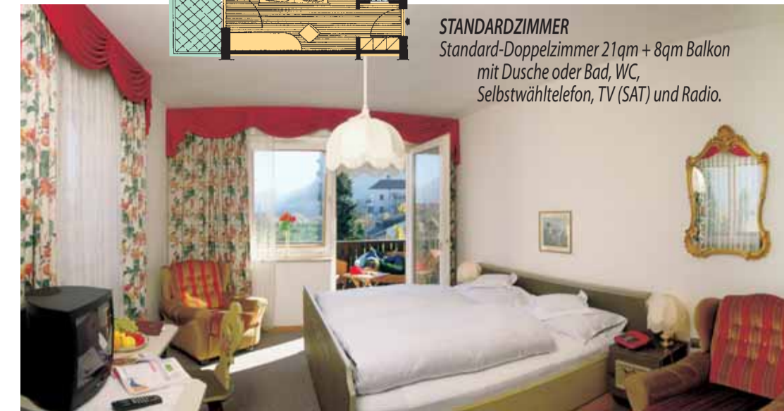
STANDARDZIMMER Standard-Doppelzimmer 21qm + 8qm Balkon mit Dusche oder Bad, WC, Selbstwähltelefon, TV (SAT) und Radio.