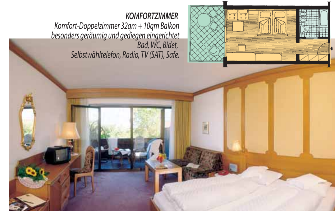
KOMFORTZIMMER Komfort-Doppelzimmer 32qm + 10qm Balkon besonders geräumig und gediegen eingerichtet, Bad, WC, Bidet, Selbstwähltelefon, Radio, TV (SAT), Safe.