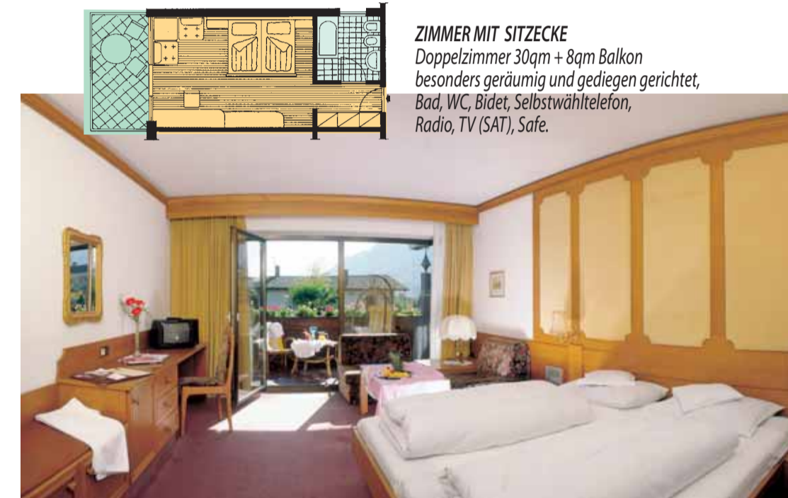
ZIMMER MIT SITZECKE Doppelzimmer 30qm + 8qm Balkon besonders geräumig und gediegen gerichtet, Bad, WC, Bidet, Selbstwähltelefon, Radio, TV (SAT), Safe.